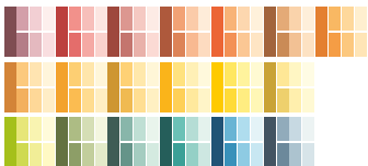
19 colour ranges

CaparolColor Compact now comprises 210 colours in 30 colour families , each with 1 full colour and 6 lightness levels. The arrangement of the colour ranges in the fan block is practicable and simplifies finding the desired nuances.